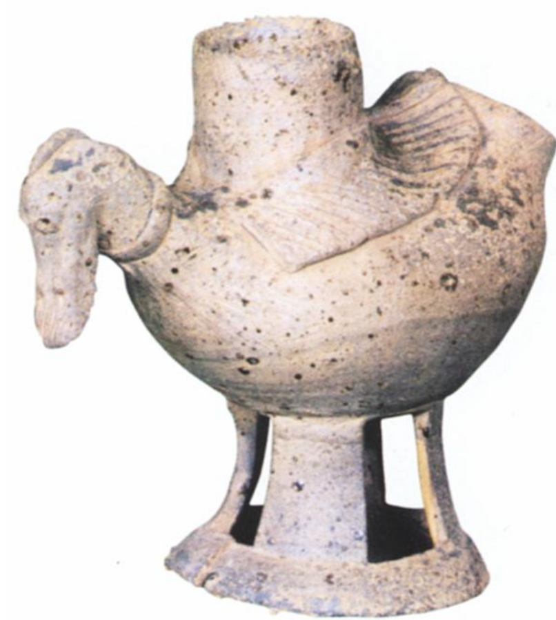
naczynie w kształcie kaczki V w n.e.