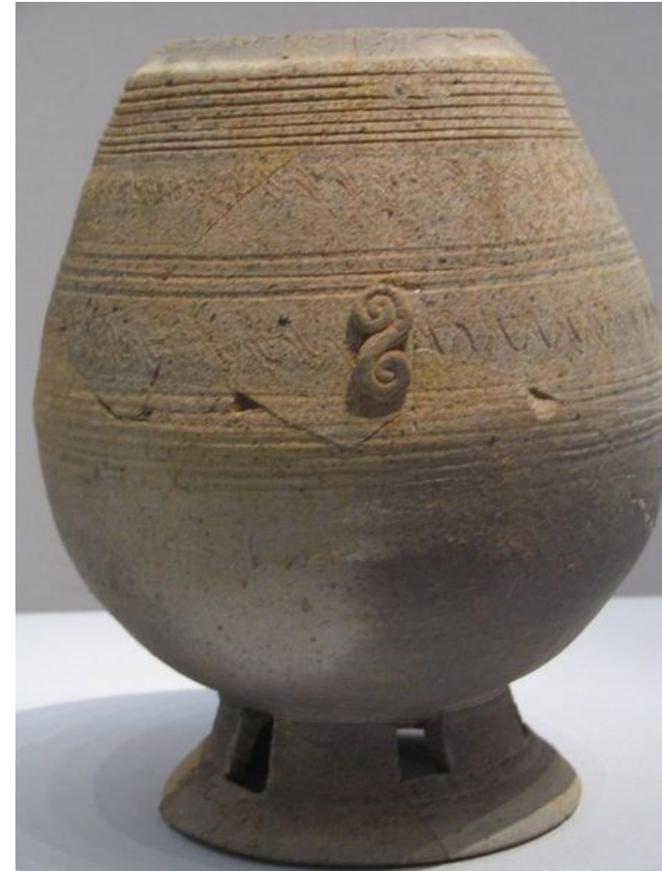
urny na prochy; V – VII w n.e.